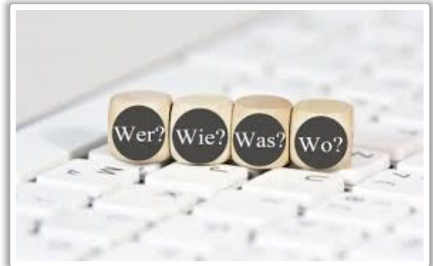
Die W-Fragen spielen für die Recherche und das Verfassen von Zeitungsartikeln eine wichtige Rolle.

Wir verwalten seit geraumer Zeit als auch eine Instagram-Seite @der_schuhspiker , welche die Schüler*innen auf einem modernen Kanal informieren soll. Hier kannst du auch deine Bloggerfähigkeiten schärfen. Du darfst uns gerne folgen, wenn du regelmässig über die wichtigsten Ereignisse der Schule informiert werden möchtest!